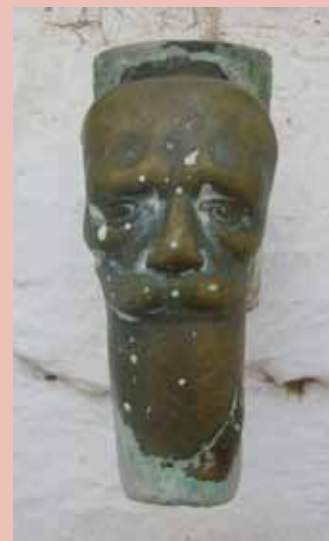
Aixeta de la font del carrer Carme

L'arribada de l'aigua potable a la població, l'any 1950 procedent de la font dels Rossegadors, va fer que l'antiga xarxa d'abastament restés en un segon terme i s'anés convertint, poc a poc, en un element residual. Els elements que actualment resten, els hem de considerar un valor patrimonial important, ja que han definit un fragment d'aquest anar fent quotidià que caracteritza la història particular del municipi.