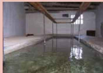
Safareig de la Nòria

El creixement del nucli de població al llarg dels darrers anys del segle XIX i el primer terç del XX va fer considerar la necessitat d'ampliar la canalització