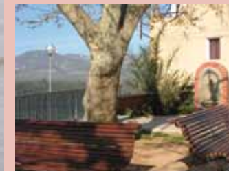
Font de la Plaça del Bruc