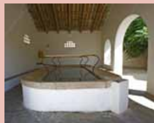
Safareig del Calvari