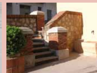
Font del carrer del Parc